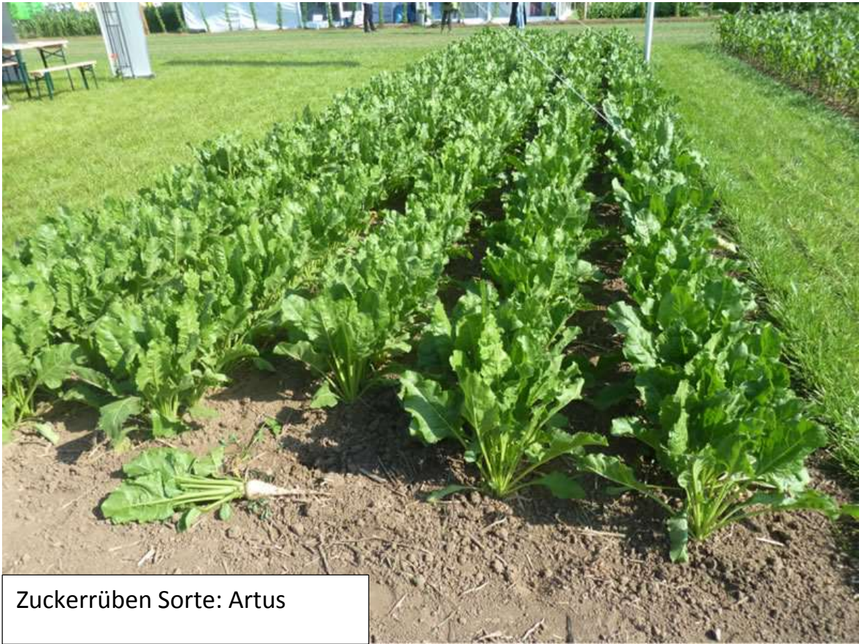
Zuckerrüben Sorte: Artus