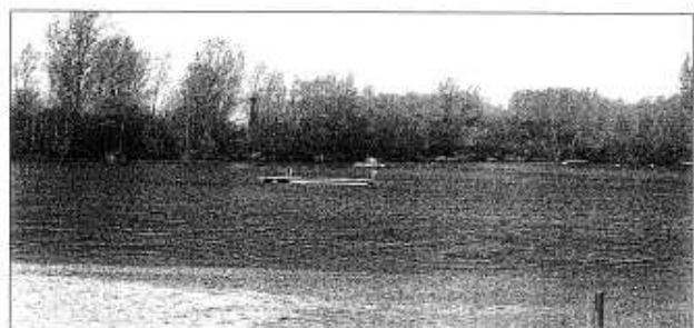
Der genesende See